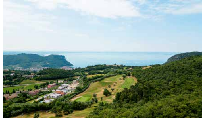
↳ Vista sul Lago di Garda dalle falesie di Marciaga / View of Lake Garda from the cliffs of Marciaga