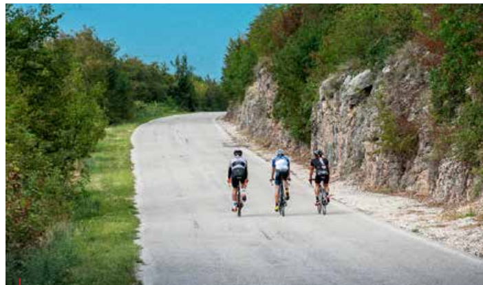
↳ Ciclisti in discesa da San Zeno di Montagna / Cyclists descending from San Zeno di Montagna