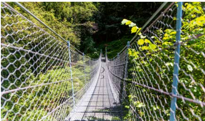
↳ Il ponte tibetano nel Vajo dell'Orsa / The Tibetan bridge in the Vajo dell'Orsa