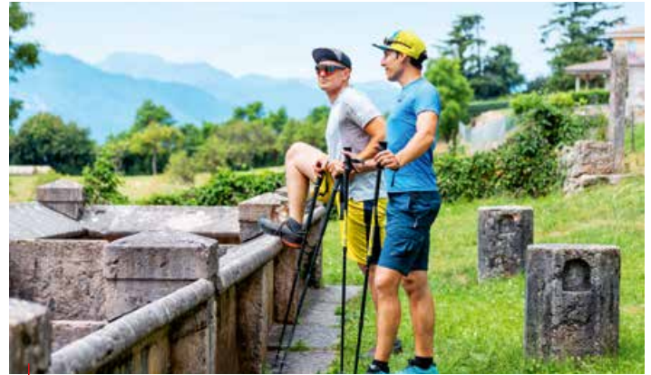
↳ Le antiche fontane di San Zeno di Montagna / The ancient fountains of San Zeno di Montagna