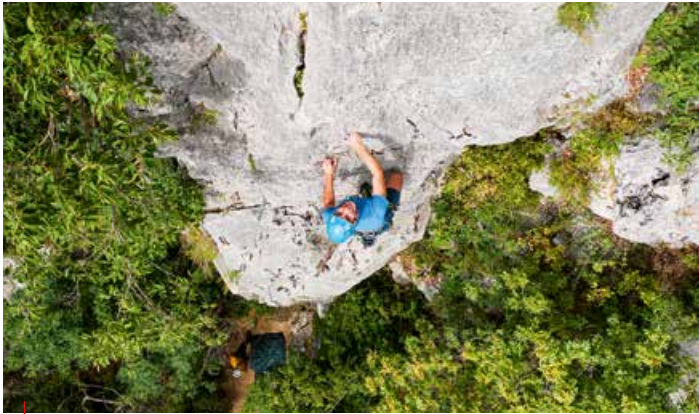
↳ Climber sulla falesia di Marciaga (Costermano) / Climber on the Marciaga crag (Costermano)