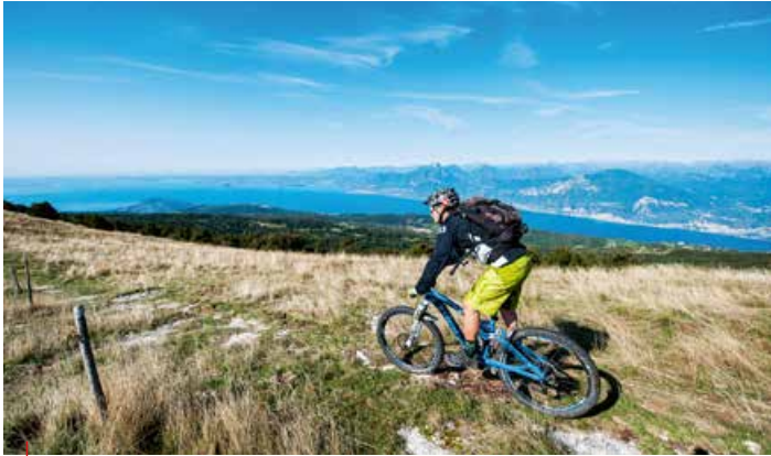
↳ Percorso panoramico sul crinale del Monte Baldo / Panoramic route on the ridge of Monte Baldo