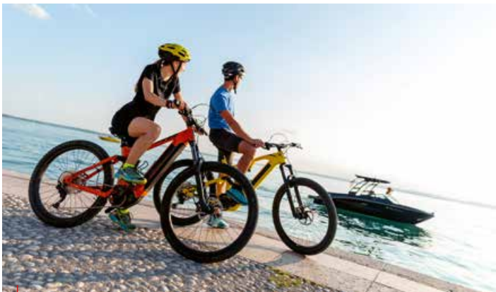
↳ Tramonto sul lungolago di Lazise / Sunset on the lakefront of Lazise