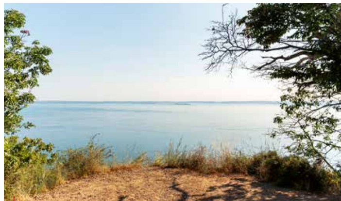
↳ Punto panoramico sulla Rocca di Garda / Viewpoint on the Rocca di Garda